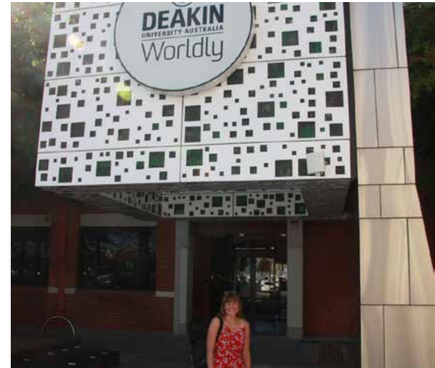
Partnerhochschule: Deakin University, Australien Master, Stadt- und Regionalplanung