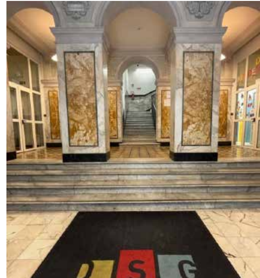
Praktikum an der Deutschen Schule Genua, Italien