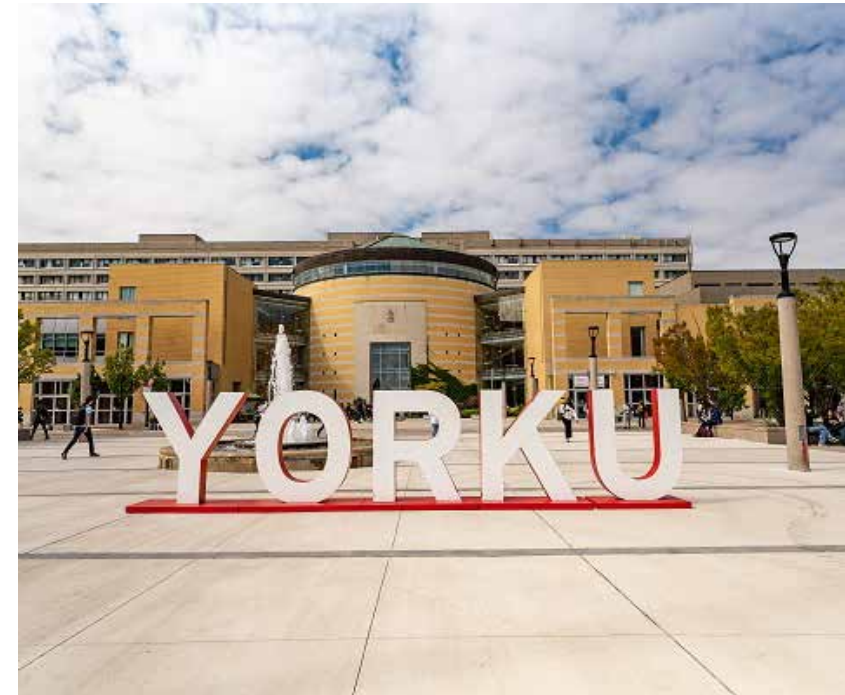
Partnerhochschule: York University, Kanada