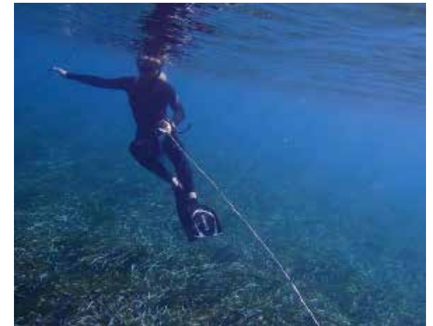
Praktikum am Archipelagos Institute of Marine Conservation Samos, Griechenland