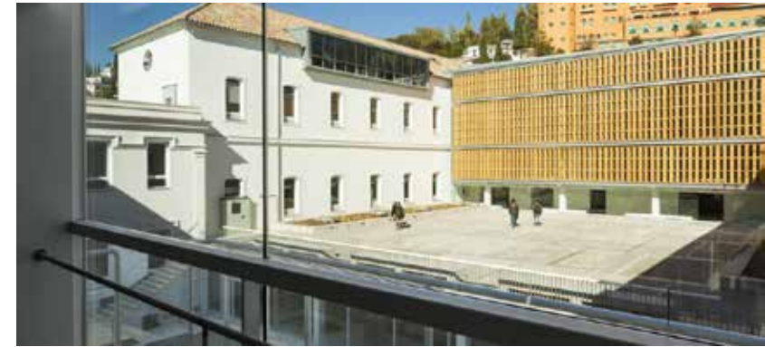
Universität Granada, Fakultät für Architektur