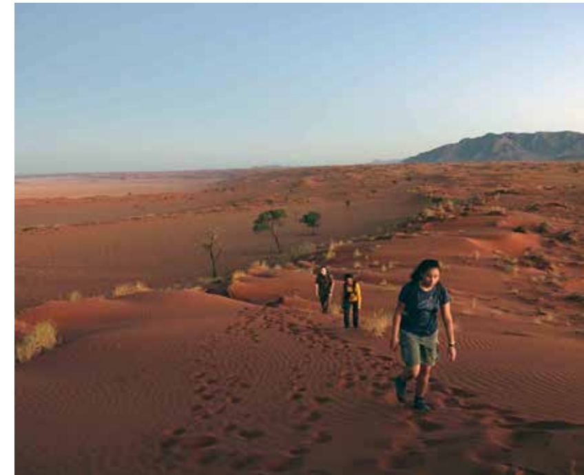
Studienreise BTU-Studierender nach Namibia Partnerhochschule: Universität von Namibia

Deutscher Akademischer Austauschdienst German Academic Exchange Service