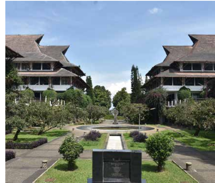
Institut Teknologi Bandung, Indonesien