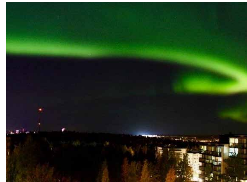
Partnerhochschule: Technical University of Tampere, Finland Master, Bauingenieurwesen

Erasmus+ Enriching lives, opening minds.