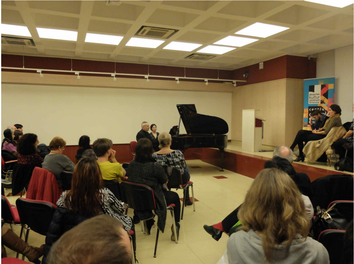
Hier ein Eindruck aus einem gemeinsamen Seminar im Dezember 2015.