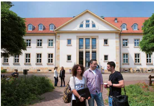
Studierende vor dem Gebäude 7, in dem sich die Musikpädagogik und die Hochschulbibliothek auf dem Campus Cottbus-Sachsendorf befindet

Darüber hinaus bieten die Zentrale Studienberatung sowie das BTU-College ganzjährig weitere Angebote und Projekte an. Neben individuellen und persönlichen Beratungsgesprächen sind zum Beispiel folgende Formate für Schülerinnen und Schüler, Schulklassen, aber auch für Eltern und Lehrer*innen verfügbar: Campustage, Frühstudium, Tage der offenen Tür, Biotechnologietage, Naturwissenschaftstage, Experimentier-Workshops in unseren Schülerlaboren, BTU on Tour-Vorträge und Workshops an den Schulen.