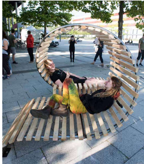
Studentinnen entspannen im »Leselooping« auf dem Forum am Zentralcampus in Cottbus. Entworfen haben dies Architektur-Studierende im Rahmen einer eigenen Kunstaktion

Während des gesamten Studiums erhalten dual Studierende eine monatliche Vergütung und sind somit finanziell abgesichert. Für ein duales Studium bewerben sich Interessierte zunächst direkt bei den Kooperationspartnern. Nach dem Bewerbungsverfahren beim Unternehmen erfolgt die Bewerbung an der BTU.