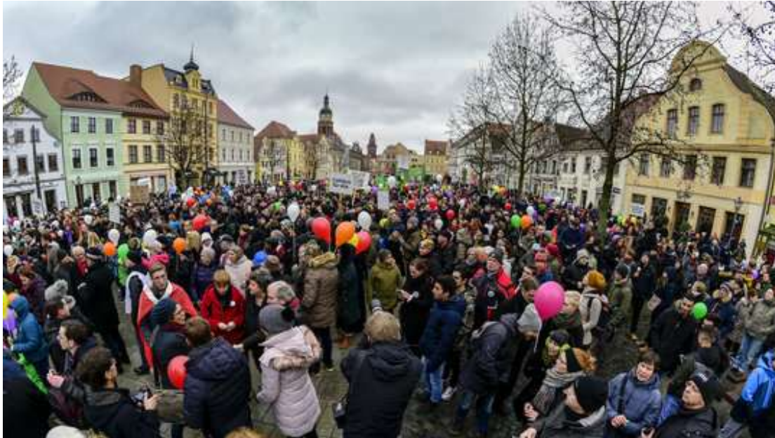
Abbildung 1: Teilnehmende bei der Demo „Leben ohne Hass“ “ (Lausitzer Rundschau/Foto: Frank Hilbert).

Gruppierungen zusammen mit Cottbusser Bürger*innen, die wiederum die Gewaltereignisse als Bestätigung ihrer rassistischen Vorurteile wahrnahmen (WAZ 2018).