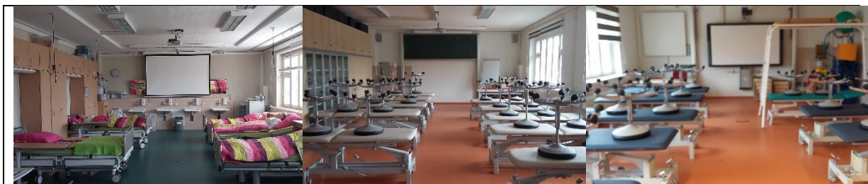
Skills Lab 1.310