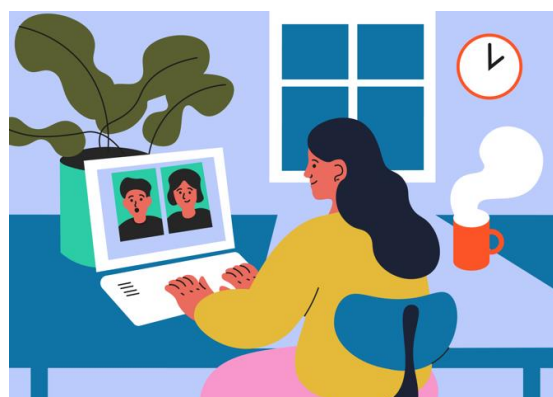
Illustration: Joanna Wilkans

Die Projekte Neksa, CurAP und KOPA veranstalten einen digitalen Fachtag für Lehrer*innen und Praxisanleiter*innen aus Berlin und Brandenburg. Neben Vorträgen erwarten Sie vielfältige Workshops und eine digitale Podiumsdiskussion. Der Fachtag ist kostenfrei und kann als Fortbildung für Lehrer*innen und Praxisanleiter*innen angerechnet werden.