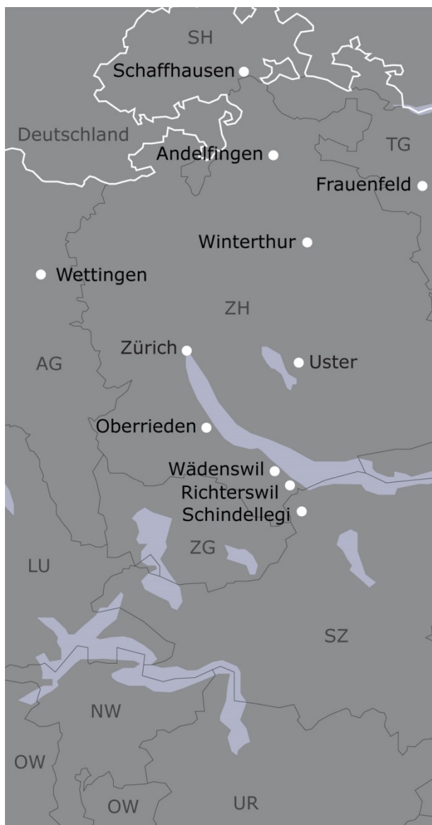
Abb. 3.01. Nordostschweiz. Ausschnitt siehe Abb. 2.01.