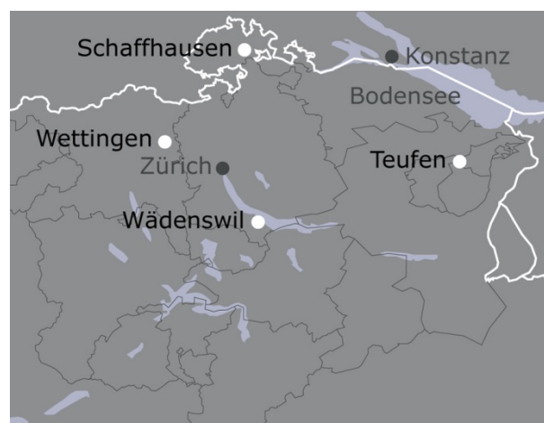
Abb. 2.02. Nordostschweiz. Relevante Orte in Grubenmanns Leben. [Stefan Giese, 2013]