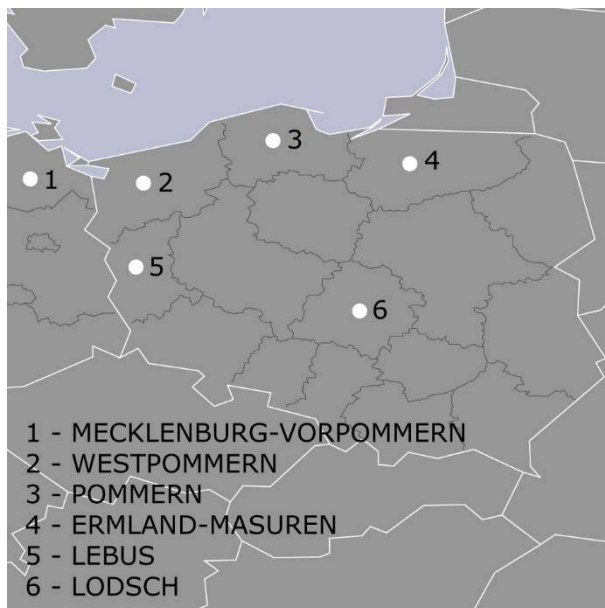
Abb. 3.03. Ausschnittkarte von Abb. 3.01. Mecklenburg-Vorpommern und polnische Woivodschaften. [Stefan Giese, 2015]