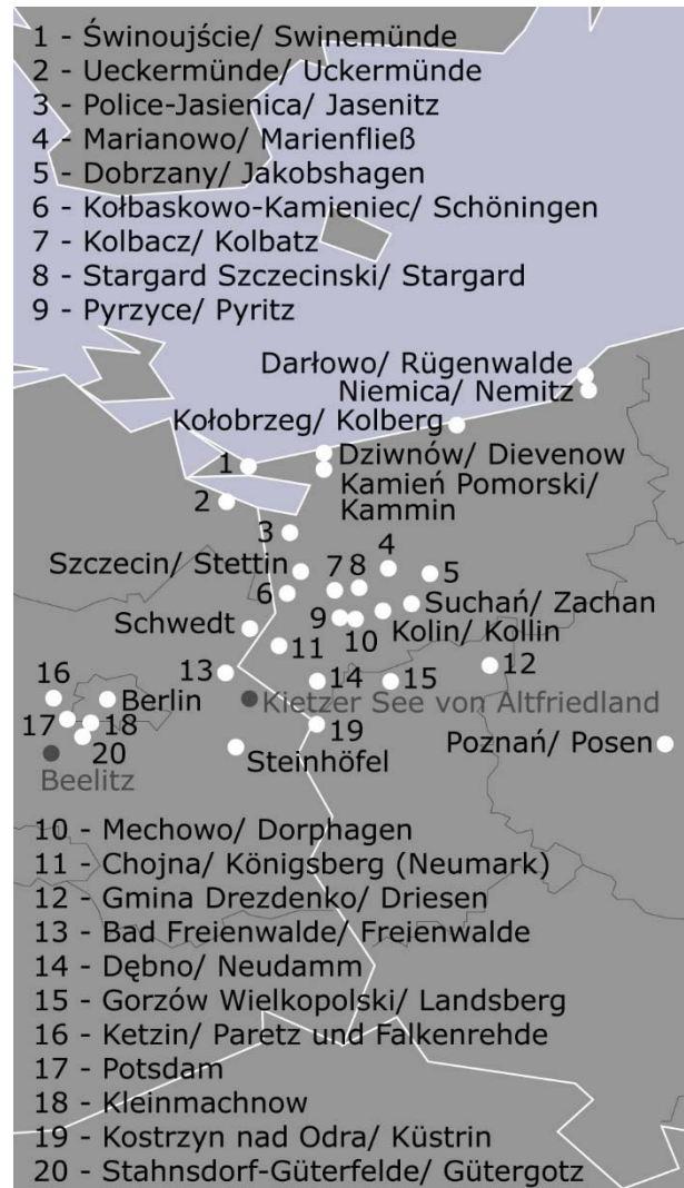
Abb. 3.02. Ausschnittkarte von Abb. 3.01. Gillys Projektstandorte in den früheren preußischen Gebieten Mittelmark (Mark Brandenburg) und Neumark sowie Vor- und Hinterpommern. [Stefan Giese, 2015]