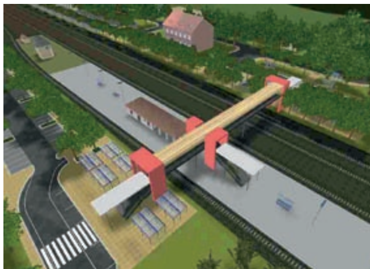
Neugestaltung des S-Bahnhofs Hoppegarten

Den Planungs- und Bauträgern im Lande Brandenburg werden in Kürze mit einem so genannten Leitfaden vielfältige Möglichkeiten der modernen Gestaltung der Verkehrsstationen des ÖV - eben nicht nur auf die Bahnhofsvorplätze beschränkt - aufgezeigt, über Erfahrungen berichtet und Hinweise und Empfehlungen zur Organisation und Moderation der Vorhaben gegeben. Als Konsulent steht der Fachausschuss Verkehr (Verknüpfungs- und Umsteigeanlagen) - FAV – beim MIR den Planungs- und Bauträgern der Landkreise und kreisfreien Städte über die bekannten Kommunikationswege zur Verfügung. ■