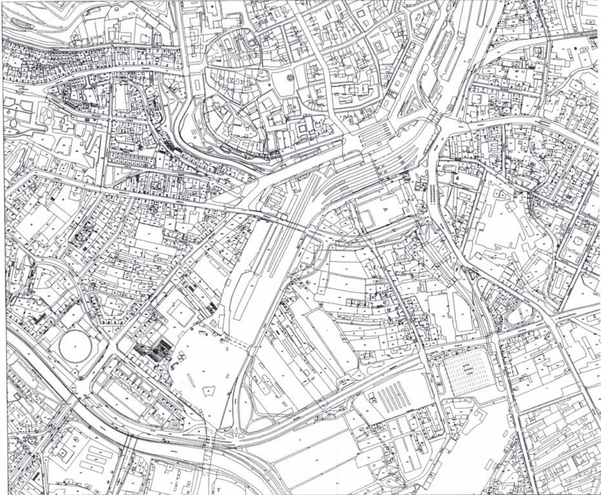
Abb. 1 Bahnanlagen und Bahnhof Brno/Brünn - Bestand und Abb. 2 (nächste Seite) geplante Neuanlage auf der Trasse einer vorhandenen Güterzugstrecke. Mit dem Neubau sollen alle zentrumsnahen Bahnanlagen aufgegeben werden