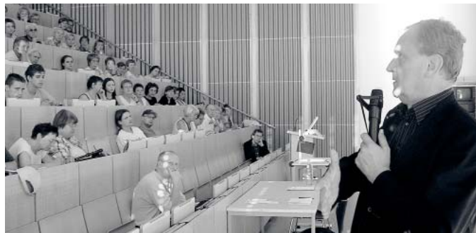
Stets gut besucht: die HöZ-Ringvorlesungen

In jedem Semester gibt es ein übergreifendes Thema, das jeweils unter verschiedenen Aspekten betrachtet wird. Mit „Kultur - Krankheiten“ hatte das HöZ-Team diesmal den Nerv einer großen Interessentengruppe getroffen. Die einzelnen Themen bargen einige Brisanz: Welche Rolle spielen die „Alltagsdrogen“ Alkohol und Nikotin in unserem Leben? Was läuft in unserem Gesundheitssystem nicht richtig? Was soll man davon halten, dass sich Menschen immer öfter aus rein kosmetischen Gründen operieren lassen? Aber auch am Anfang und dem Ende des Lebens eines Menschen stellen sich wichtige Fragen: Was kann, was darf die Neonatologie, um ein Frühgeborenes am Leben zu erhalten, eventuell um den Preis schwerer Schädigungen? Und welche medizinischen Behandlungen sind im hohen Lebensalter noch sinnvoll,