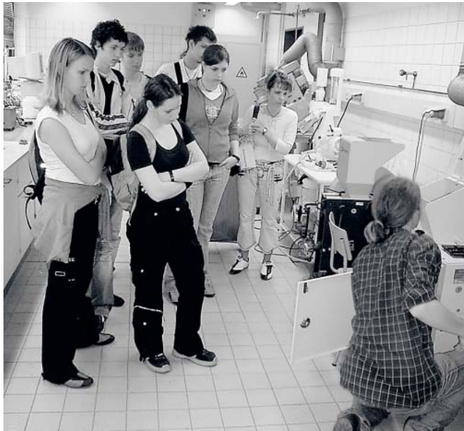
Laborbesuch bei den Aufbereitungstechnikern