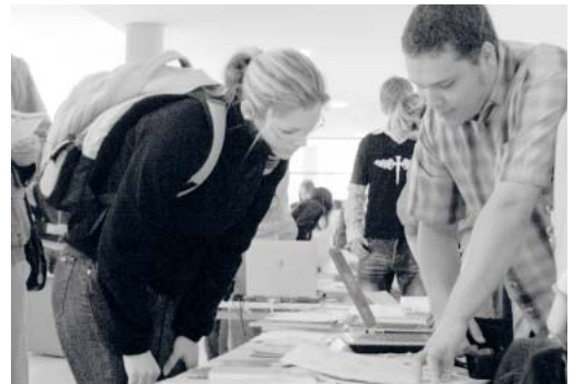
Reges Interesse für die Infoangebote der vier Fakultäten, der Einrichtungen und Partner der BTU im Audimax-Foyer.