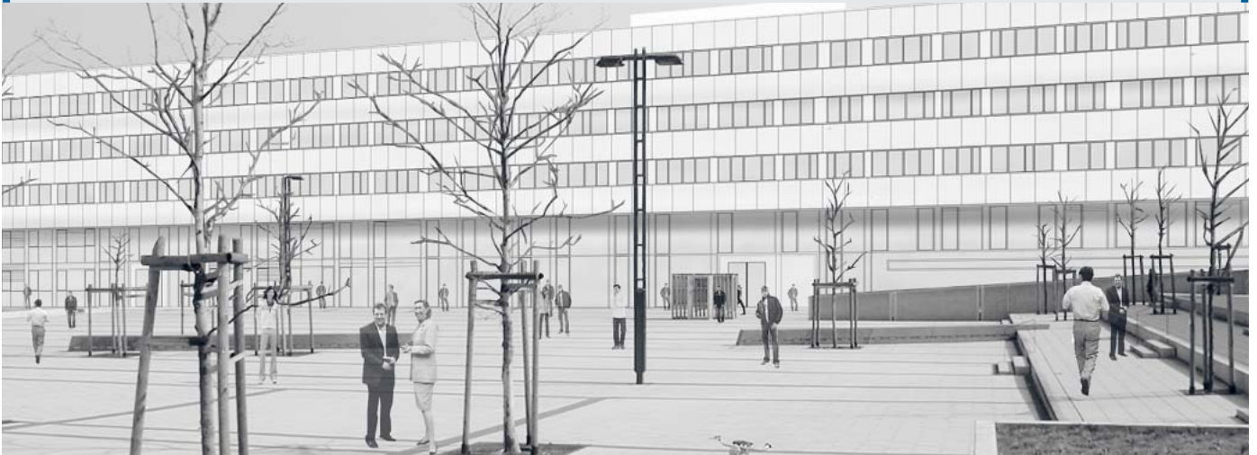
Eine Vision des Hauptgebüdes nach der Sanierung. Das straßenseitige Wandbild wird demontiert, der Vorbau mit einer zweigeschossigen Glasfassade neu errichtet. Die Durchlässigkeit des Erdgeschosses verbindet den Campus optisch mit dem dahinter liegenden IKMZ.

Am 29. Juni feierte die Architekturwerkstatt Cottbus (AWC) mit einem Fest im Innenhof der Lehrgebäude 2C/D, ihrem ersten Projekt, ihr 10-jähriges Bestehen.