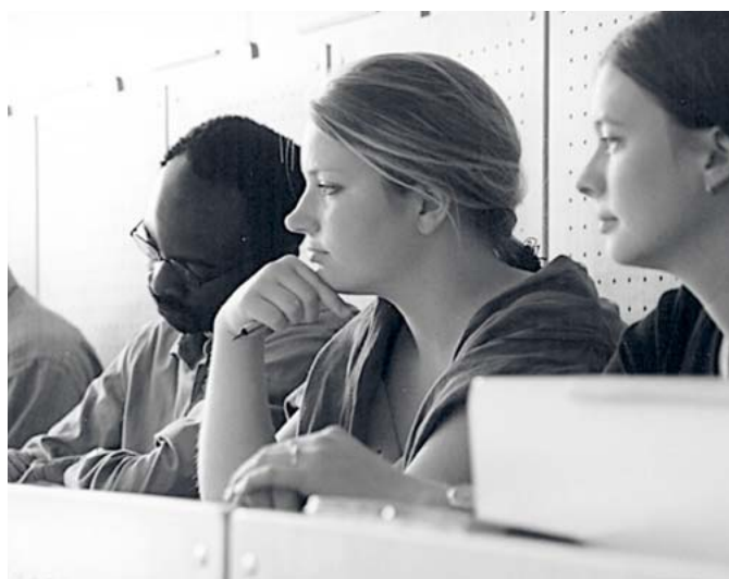
Das Angebot internationaler Studiengänge mit mehreren Partnern im Ausland soll an der BTU erweitert werden.

Mit dem projektierten Auf- und Ausbau von Hochschul- und institutionellen Netzwerken an der BTU sollen durch ein vermehrtes