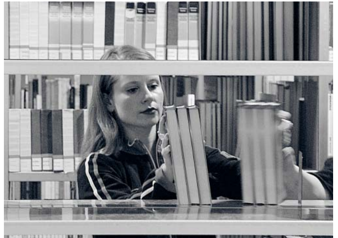
Nach dem Umzug ins neue IKMZ-Gebäude kann die Cottbuser Uni-Bibliothek wesentlich bessere Arbeitsbedingungen bieten.

Belegte die Cottbuser UB im vergangenen Jahr noch den 12. Rang, gelang ihr in diesem Jahr der Sprung nach vorn. Ausschlaggebend hierfür war die Entwicklung der Bibliothek im letzten Jahr. Im IKMZ-Neubau steht den Forschenden, Lehrenden und Studierenden der BTU, aber auch den Bürgern aus Stadt