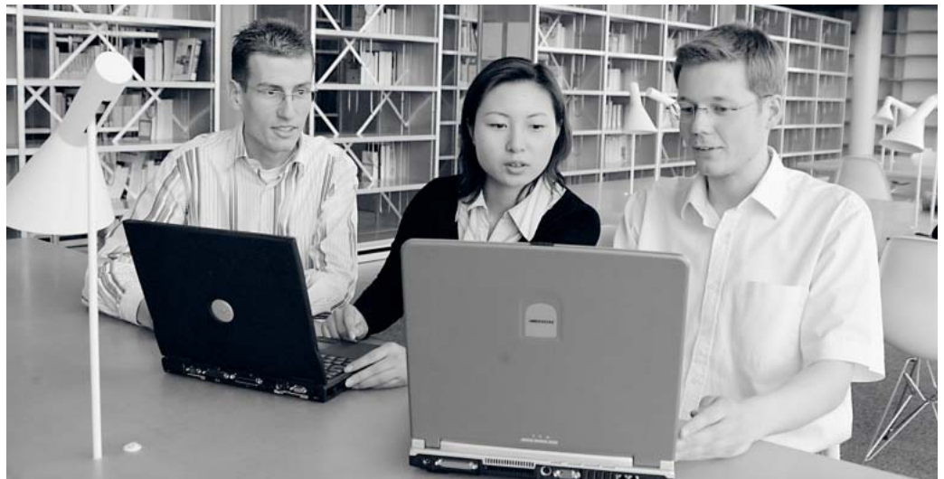
Die BTU setzt weiterhin auf eLearning-Projekte.

Ziel des Vorhabens ist ein umfassendes Change-Management, mit dem eine nachhaltige Verankerung computergestützter Lehre im Studienangebot der Hochschule angestrebt wird. Die BTU Cottbus gehört damit - als einzige brandenburgische Hochschule - zu den rund 20 Universitäten, die eine solche Förderung im Rahmen der BMBF-Ausschreibung erhalten haben. Das Vorhaben lässt eine höhere Attraktivität des Studienangebots und eine stärkere Wettbewerbsfähigkeit der BTU Cottbus erwarten. Die Projektarbeiten knüpfen dabei an Modelllösungen an, die schon jetzt interaktives und multimediales Studieren an der BTU ermöglichen. Ein verstärkter Einsatz von Softwareanwendungen für die Studienorganisation und eine breitere Nutzung von Lernplattformen bieten gute Voraussetzungen, um eine signifikante Integration von e-Lear-