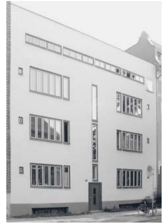
August-Bebel-Str. 44, der Sitz der AWC