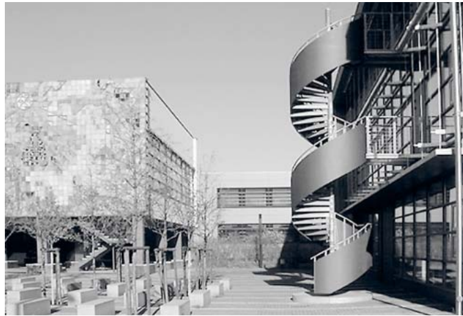
Innenhof der Lehrgebäude 2C und D mit neuem Anbau und altem Wandbild

In den 10 Jahren ihres Bestehens betreute die Architekturwerkstatt neben Sanierung und Neubau der Lehrgebäude 2A-D – auch den Umbau ihres eigenen Büros in der August-Bebel-Straße. Aber auch Projekte ohne direkten universitären Bezug gehören zu den AWC-Referenzen, so zum Beispiel die Sanierung eines Gebäudes in der Cottbuser Schillerstraße, die Entwicklungsplanung für die Kulturhöfe Petersilienstraße oder die Erweiterung des Servicestandorts Schwarze Pumpe der FAM Anlagen Service GmbH Lausitz (För-