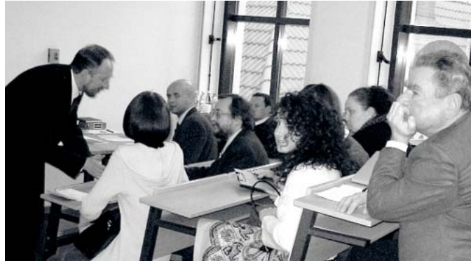
Das Organisatorenteam der Veranstaltung „Entwicklung des Luftreinhaltrechts und Emissionsrecht in Polen und Deutschland“, die im Februar 2005 an der Universität Wrocław (Breslau) stattfand.