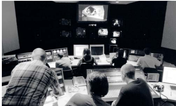
Livesendung aus dem Tonstudio.

Parallel dazu wurde in der Fakultät 2 ein Seminar Plastisches Gestal-