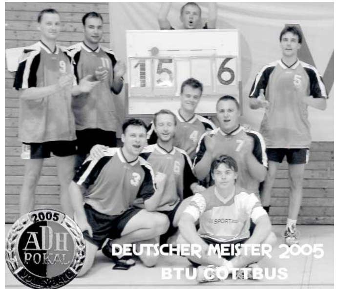
Das erfolgreiche BTU-Volleyballerteam.

Der erste Satz wurde mit 25:18 gewonnen. Im zweiten Satz war damit der Widerstand des Gegners gebrochen - die Partie endete 25:9. Somit stand erstmals ein Cottbuser Team in einem Finale um den ADH-Pokal. Unerwartet eindeutig setzte sich Freiburg im zweiten Halbfinale mit 2:0 gegen den anderen Gruppensieger Weingarten durch. Im Finale kam es zum erneuten Duell zwischen der BTU und den Freiburgern. Die Freiburger spielten mit der Erfahrung von vier gewonnenen Finals ruhig und abgeklärt. Währenddessen machte sich auf Cottbuser Seite ab Mitte des ersten Satzes etwas Nervosität breit. Eine starke Aufschlagserie war dann