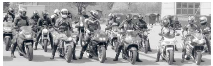
Fahren, drüber reden und Spaß haben mit Freunden - das ist es, was die Faszination Motorrad für die BTU-Biker ausmacht!