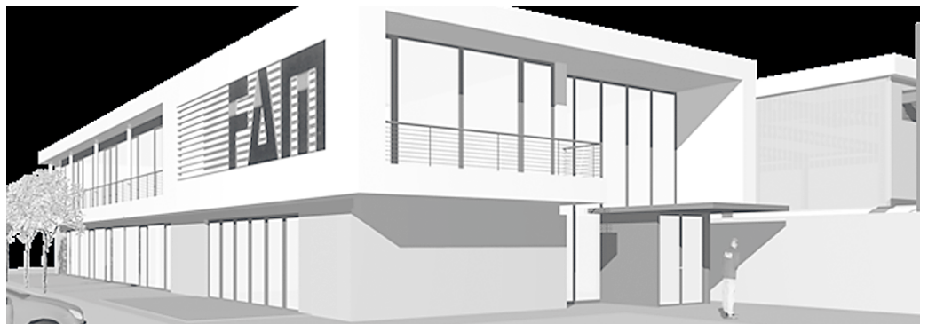
Gebäudestudie des Servicestandorts Schwarze Pumpe