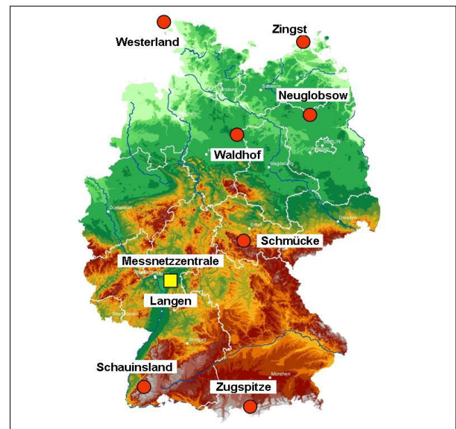
Abb. 2: Geographische Lage der UBA-Messstationen

Das Messnetz des Umweltbundesamtes (Abb. 2) besteht seit über 30 Jahren. Die im ländlichen Raum gelegenen Messstationen ermitteln weiträumig und grenzüberschreitend herantransportierte Luftmassen.